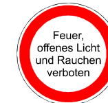
Feuer, offenes Licht und Rauchen verboten