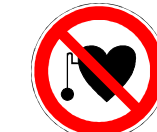
Verbot für Personen mit Herzschrittmacher