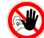
Zutritt für Unbefugte verboten